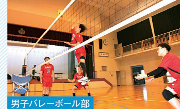
男子バレーボール部