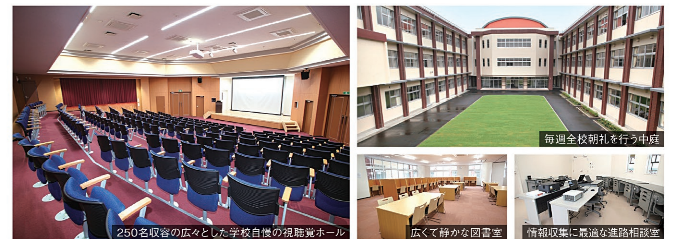
250名収容の広々とした学校自慢の視聴覚ホール

全ての教室・実習室に冷暖房が完備された快適な学習環境です。また、体育館や武道館、テニスコートなどのスポーツ施設も充実しています。