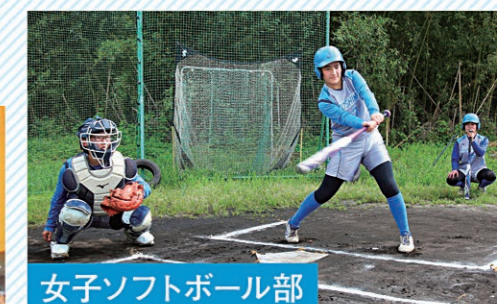
女子ソフトボール部