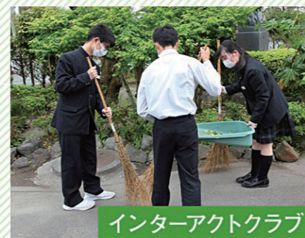
インターアクトクラブ